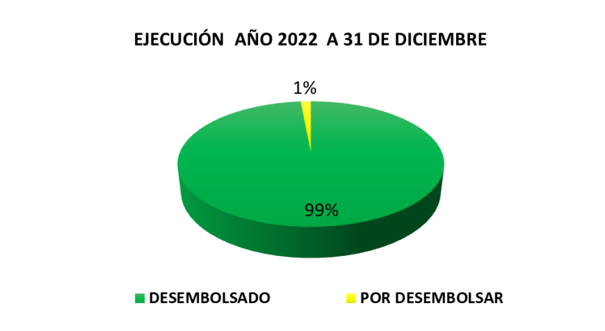
Gráfico 2- Relación de Recursos Ejecutados a 31 de Diciembre de 2022