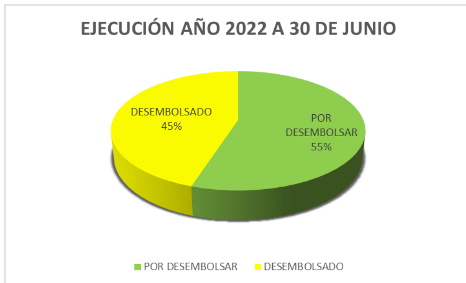
Gráfico 2- Relación de Recursos Ejecutados a 30 de Junio de 2022