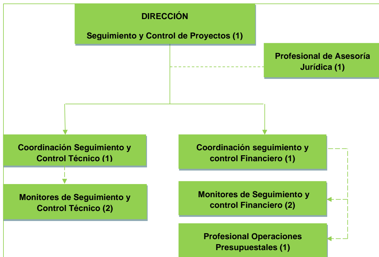
Gráfica 1- Estructura Operativa SyC año 2021